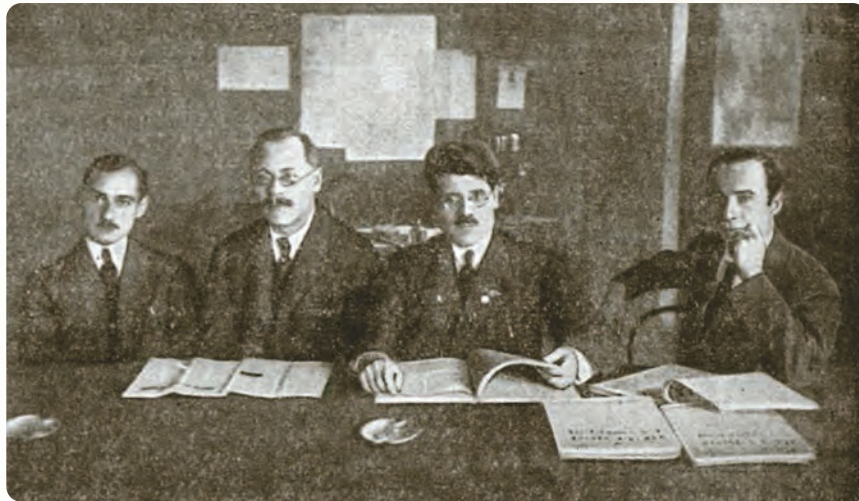
Первая редколлегия журнала «Нефтяное и сланцевое хозяйство»